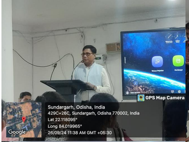
Sundargarh, Odisha, India 429C+26C, Sundargarh, Odisha 770002, India Lat 22.118095° Long 84.019965° 26/09/24 11:38 AM GMT +05:30