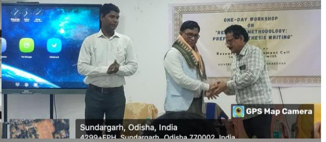
Sundargarh, Odisha, India 4298+EPH, Sundargarh, Odisha 770002, India