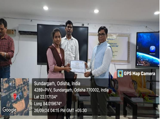
Sundargarh, Odisha, India 4289+PVV, Sundargarh, Odisha 770002, India Lat 22.117134° Long 84.019674° 26/09/24 04:15 PM GMT +05:30