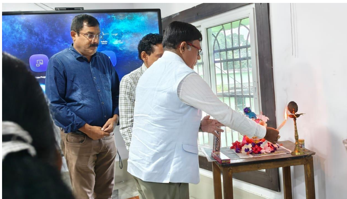
Lighting of the Lamp by the honourable resource person & Principal of Government College, Sundargarh