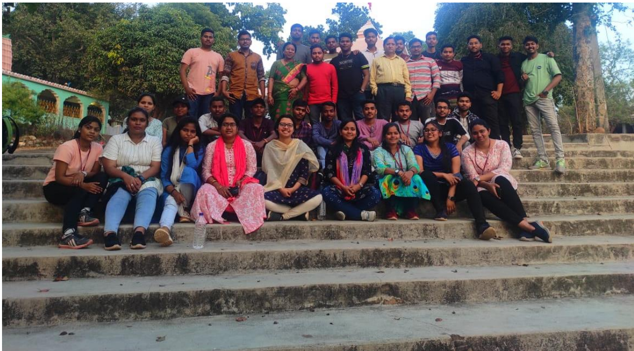
(Group Photo near Koteibira Shiva Temple)