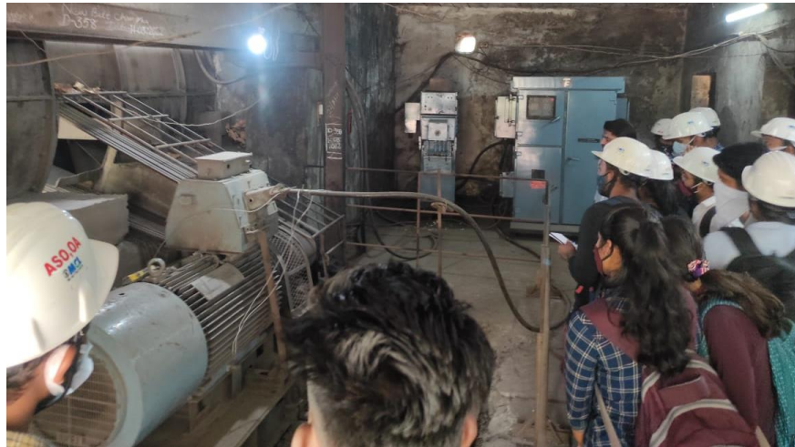
(Machinery used for different equipment)