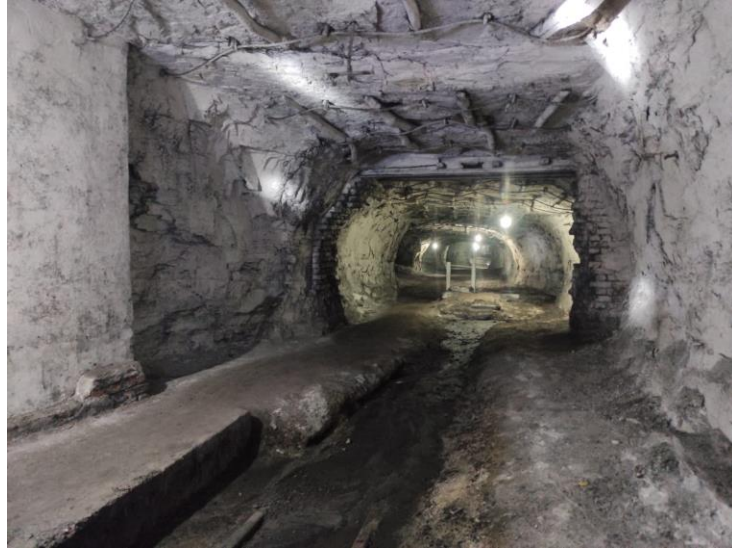
(Inside the UG Coal Mines)