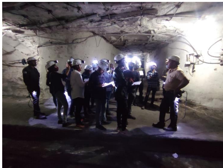
(Geologist Explaining the concept of UG Mines)