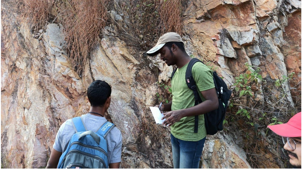
(Study of large exposures)