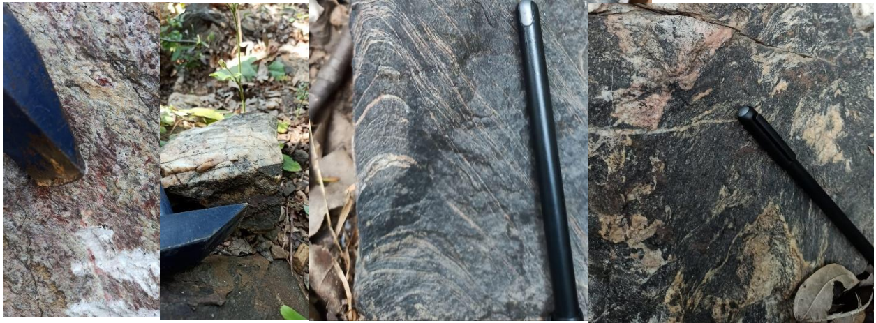
(Different rock types found in the Sarafgarh Region, Sundargarh)