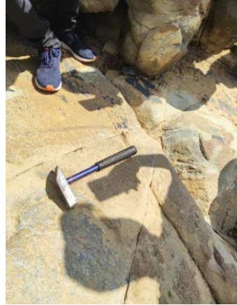
(Some Exposures in the Study Area)