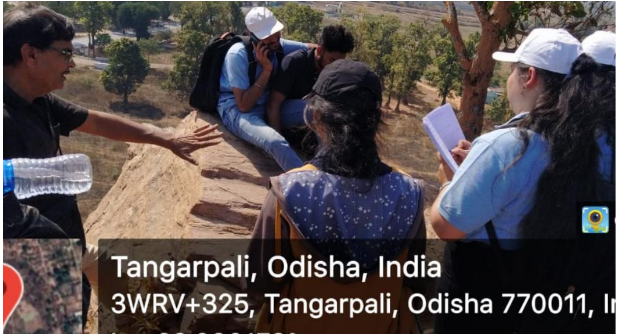
(Exposure study at Tangarpali, Sundargarh)