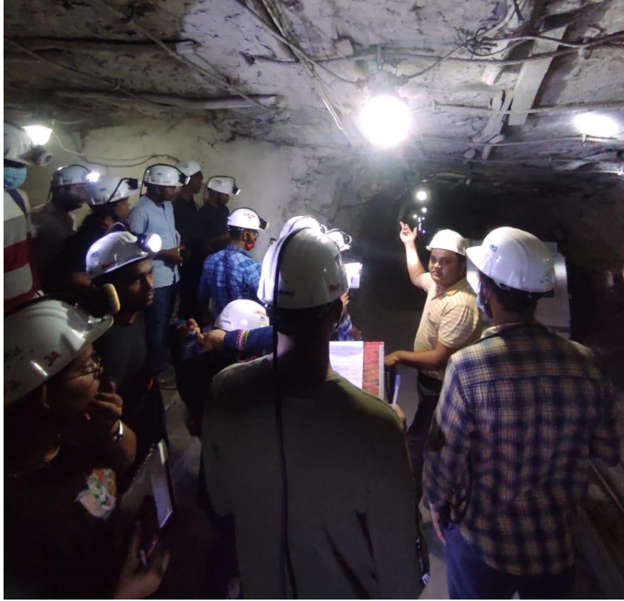
(Mines Support system)