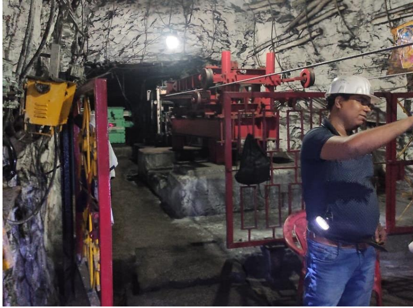
(Man rider, chair lift system inside the Underground mines)